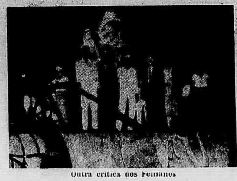
Outra critica dos Femininos